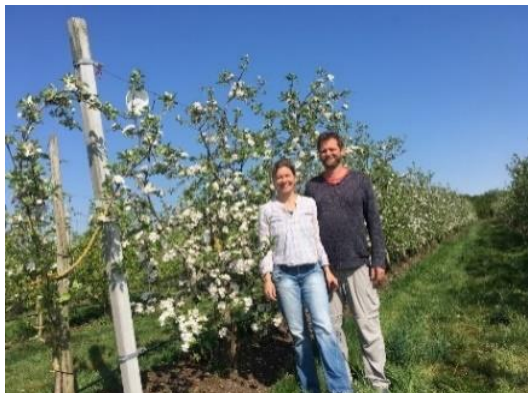
Hoeve de Heivelden