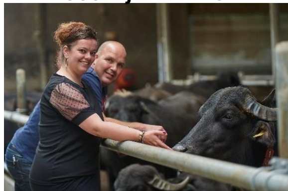
BFFL BrAbAnt, Heeswijk-Dinther