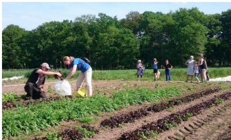
Herenboerderij Landmeerse Loop